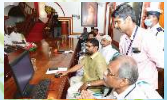
ആട്ടോമേറ്റഡ് ലൈബ്രറി ഉദ്ഘാടനം