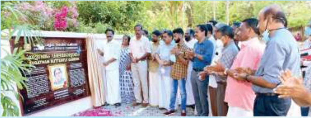
'സുഗതം' ശലഭോദ്യാനം ഉദ്ഘാടനം