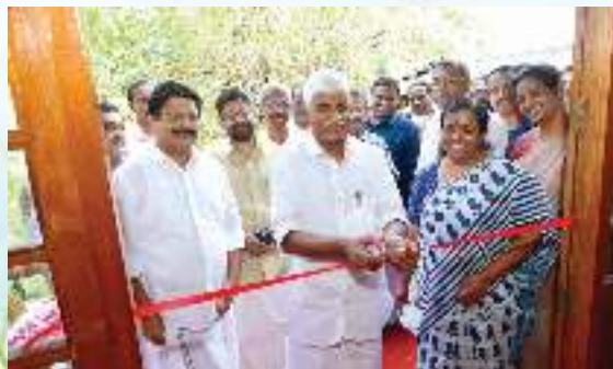
നവീകരിച്ച പൈതൃക മന്ദിരം ഉദ്ഘാടനം